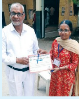
सबसे पहला वोट डालकर बीएलओ दे सट्टीफिकेट लेते हुए