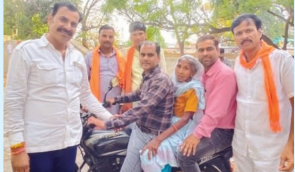
बुजुर्ग महिला को वोट डलवाने के लिए ले जाते कार्यकर्ता

रावतभाटा। लोकसभा चुनाव के दूसरे चरण में चित्तौड़गढ़ लोकसभा क्षेत्र में शुक्रवार को मतदान हुआ। मतदान अपने तय समय सुबह 7 बजे शुरू हुआ जो शाम 6 तक चलता रहा। जागरूक मतदाता मतदान शुरू होने से पहले ही अपने बूथ पर पहुंच गए। शुरुआती कुछ घंटे में मतदान की रफ्तार धीमी रही, दोपहर बाद मौसम बदलते ही मतदान की भी रफ्तार बढ़ गई। रावतभाटा क्षेत्र में मतदान समाप्त होने के बाद 71.7 प्रतिशत मतदान हुआ जिसमें सर्वाधिक भाग संख्या 221 लोटीयाना पर हुआ, सबसे कम भारी पानी संयंत्र आवासीय कॉलोनी की भाग संख्या 279 पर 30.21 प्रतिशत मतदान हुआ। मतदान की रफ्तार धीमी देखते हुए सहायक निर्वाचन अधिकारी उपखंड अधिकारी