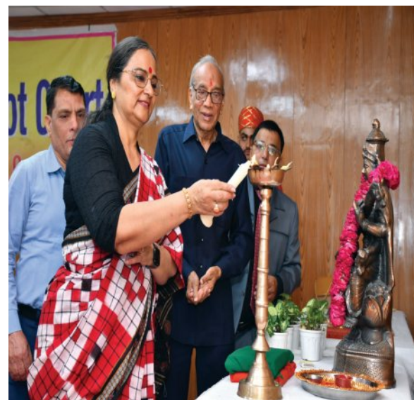
खबरों की दुनिया

जयपुर। विधि महाविद्यालय केन्द्र-2 राजस्थान विश्वविद्यालय, जयपुर में लाइव मॉडल मूट कोर्ट का आयोजन किया गया।