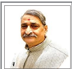
आर. के. सिन्हा पूर्व सांसद, राज्यसभा

यकीन मानिए कि किसी देश और वहां के लोगों को जानने के लिए आपको कोई बहुत चुम्बकड़ी करने की जरूरत नहीं है। आप जिस देश के समाज को जानना चाहते हैं, उसके एयरपोर्ट से उतरने के बाद वहां की सड़कों में चल रहे यातायात को देख भर लें। आपको सब कुछ पता चल जायेगा कि वहां का समाज कितना अनुशासन प्रिय है या अराजकता में कितना यकीन करता है। राजधानी दिल्ली की सड़कों से गुजरते हुए यहां पहली बार आने वाले शख्स को इतना तो पता ही चल जाता होगा कि इधर की सड़कों पर यातायात नियमों को मानना भी लोग अपनी शान के खिलाफ समझते हैं। बेशक, राजधानी दिल्ली की सड़कों का नजारा देखकर डर लगता है। दो पहिया चलाने वाले न जाने कितने ड्राइवर दिखाई देते हैं, जिन्होंने हेलमेट नहीं पहना होता है। बात यही खत्म