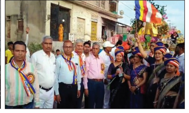
धौलपुर • खबरों की दुनिया