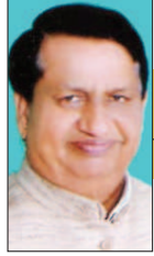
डॉ. ए.पी.जे. आबुलकलाम

लोकसभा चुनावों का पहला चरण 19 अप्रैल को समाप्त हो गया है। इस चरण में हुए कम मतदान ने पार्टियों और प्रत्याशियों की आंखें खोल कर रख दी हैं। भारत में लोकतंत्र अभी इतना विकसित नहीं हुआ है कि लोग स्वैच्छा से मतदान करने पार्टी या प्रत्याशी के नाम पर मतदान केन्द्र पर पहुंचे और पहुंचे भी क्यों? मतदान करने के बाद उसे पछता कौन है? इस बार तो मतदान से पहले भी उसे किसी ने नहीं पछा। 'खबरों की दुनिया' के रिपोर्टर ने विभिन्न इलाकों का दौरा करने के बाद बताया कि कई इलाकों में तो किसी पार्टी का कोई नुमाइंदा तक नहीं पहुंचा, केवल पंचियां ही पहुंची हैं। भारत का मतदाता बिना आवभगत के वोट देने नहीं जाता है। उसे लाने ले जाने के लिए भी पार्टी या प्रत्याशी के द्वारा प्रचालित वाहन चाहिए।