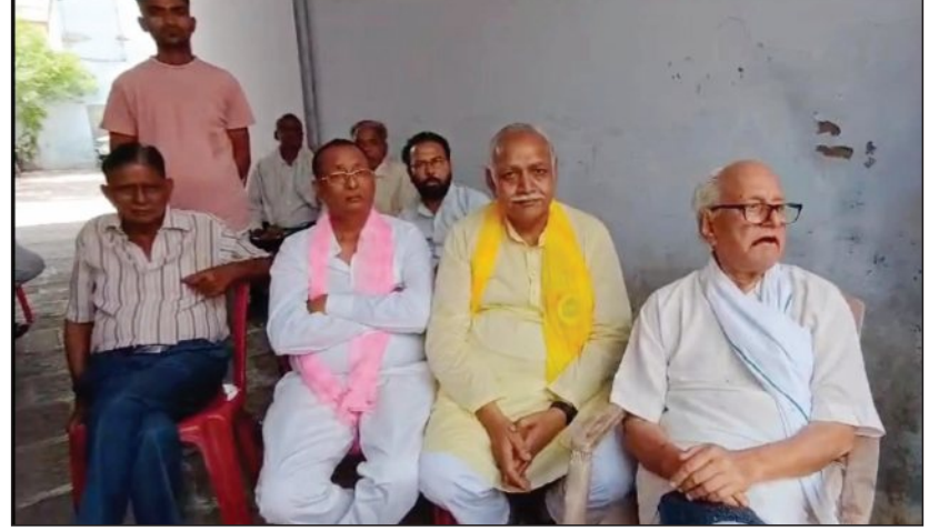
राजाखेड़ा • खबरों की दुनिया