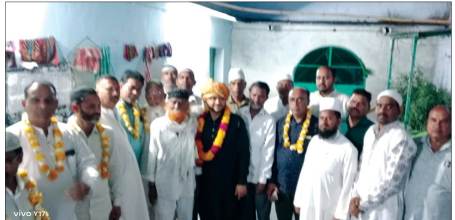
खबरों की दुनिया