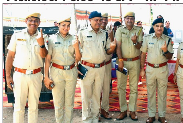
खबरों की दुनिया