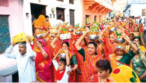
खबरों की दुनिया