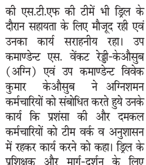
खबरों की दुनिया

भुसावर। कस्बा भुसावर के रमेश स्वामी पार्क पर चैत्र मास की दुर्गाअष्टमी पर एक दिवसीय मेले का आयोजन हुआ। जहां व्यापारियों ने बच्चों के मनोरंजन के लिए झूलें सहित विभिन्न प्रकार की दुकानें सजाईं। कस्बा भुसावर में आयोजित हुए एक दिवसीय मेले में लगी मिट्टी से बने बर्तनों की दुकानों पर लोगों ने गर्मी को देखते हुए बर्तन खरीदे तो दूसरी ओर मेले में चाट एवं झूलों का भी जमकर आनंद लिया। भुसावर में आयोजित हुए मेले में पुलिस प्रशासन पूरी तरह मुस्तैद रहा। वहीं दूसरी ओर कस्बा भुसावर के शैतानपाडा मंदिर से पुरानी परम्पराओं को निभाते हुए माता का झण्डा एवं माता की शोभायात्रा बैण्ड बाजों के साथ निकाली गयी। भक्तों ने माता के दर्शन कर आरती उतारते हुए हाजरी लगायी। माता को कराये गये नगर भ्रमण के दौरान भक्तों द्वारा गाये जा रहे भजनों से पूरा वातावरण गुंजायमान और भक्तिमय हो गया। शोभायात्रा मंदिर प्रांगण से शुरू होकर मुख्य बाजार, पुरानी अनाज मण्डी, चौरा का मंदिर से खेल मैदान पहुंची। जहां माता के भजन गाकर माता को रिझाया गया। जिसके बाद शोभायात्रा का समापन मंदिर पर महाआरती करते हुए किया गया।