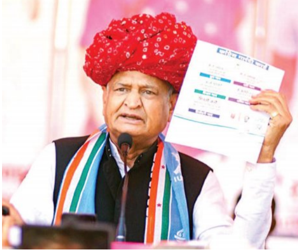
पीएम इलेक्टोरल बॉन्ड की सफाई देते घूम रहे: गहलोत

संवैधानिक पदों पर चुने हुए लोगों को जेल के अंदर खाल दिया। कांग्रेस के 12 खातों को बंद कर दिया।