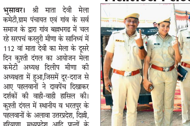
खबरों की दुनिया