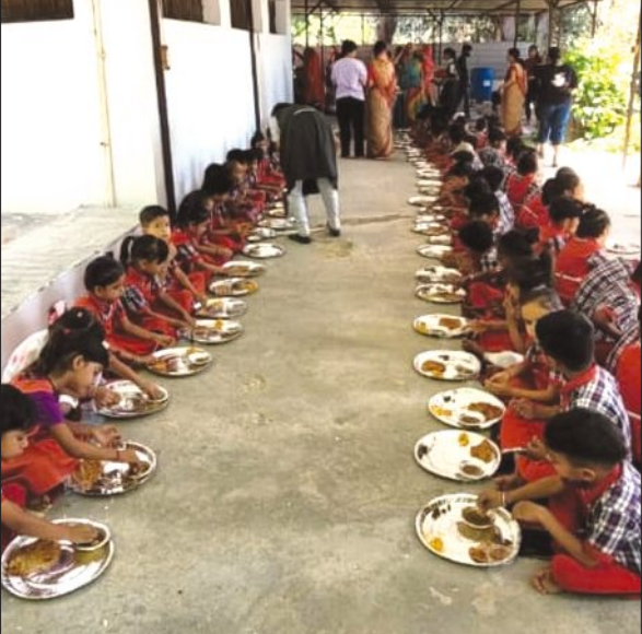
खबरों की दुनिया