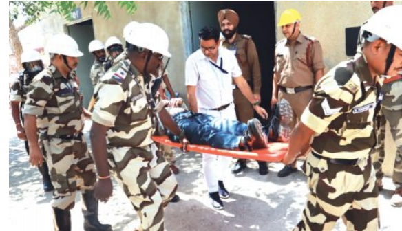
खबरों की दुनिया

रावतभाटा। राजस्थान परमाणु बिजलीघर के कर्मचारियों व सविदा कर्मचारियों आम नागरिकों, स्कूली बच्चों और चिकित्सा कर्मियों को अग्नि संरक्षा के प्रति जागरूक करने के लिए अग्निशमन सेवा सप्ताह के दौरान विभिन्न अग्नि संरक्षा कार्यक्रमों के आयोजन के दौरान विभिन्न प्रतियोगिताओं, प्रशिक्षणों, जागरूकता कार्यक्रमों और मॉक ड्रिल का आयोजन किया गया। कर्मचारियों सविदा कर्मचारियों के लिए विवज, निबंध, स्लोगन और पोस्टर प्रतियोगिताओं एवं