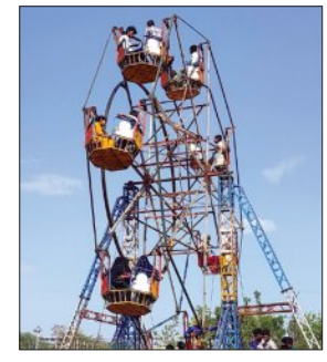
खबरों की दुनिया

भुसावर। कस्बा भुसावर के रमेश स्वामी पार्क पर चैत्र मास की दुर्गाअष्टमी पर एक दिवसीय मेले का आयोजन हुआ। जहां व्यापारियों ने बच्चों के मनोरंजन के लिए झूलें सहित विभिन्न प्रकार की दुकानें सजाईं। कस्बा भुसावर में आयोजित हुए एक दिवसीय मेले में लगी मिट्टी से बने बर्तनों की दुकानों पर लोगों ने गर्मी को देखते हुए बर्तन खरीदे तो दूसरी ओर मेले में चाट एवं झूलों का भी जमकर आनंद लिया। भुसावर में आयोजित हुए मेले में पुलिस प्रशासन पूरी तरह मुस्तैद रहा। वहीं दूसरी ओर कस्बा भुसावर के शैतानपाडा मंदिर से पुरानी परम्पराओं को निभाते हुए माता का झण्डा एवं माता की शोभायात्रा बैण्ड बाजों के साथ निकाली गयी। भक्तों ने माता के दर्शन कर आरती उतारते हुए हाजरी लगायी। माता को कराये गये नगर भ्रमण के दौरान भक्तों द्वारा गाये जा रहे भजनों से पूरा वातावरण गुंजायमान और भक्तिमय हो गया। शोभायात्रा मंदिर प्रांगण से शुरू होकर मुख्य बाजार, पुरानी अनाज मण्डी, चौरा का मंदिर से खेल मैदान पहुंची। जहां माता के भजन गाकर माता को रिझाया गया। जिसके बाद शोभायात्रा का समापन मंदिर पर महाआरती करते हुए किया गया।