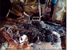
खबरों की दुनिया