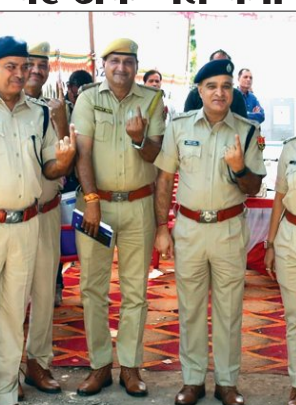
खबरों की दुनिया

रावतभाटा। राजस्थान परमाणु बिजलीघर के कर्मचारियों व सविदा कर्मचारियों आम नागरिकों, स्कूली बच्चों और चिकित्सा कर्मियों को अग्नि संरक्षा के प्रति जागरूक करने के लिए अग्निशमन सेवा सप्ताह के दौरान विभिन्न अग्नि संरक्षा कार्यक्रमों के आयोजन के दौरान विभिन्न प्रतियोगिताओं, प्रशिक्षणों, जागरूकता कार्यक्रमों और मॉक ड्रिल का आयोजन किया गया। कर्मचारियों सविदा कर्मचारियों के लिए विवज, निबंध, स्लोगन और पोस्टर प्रतियोगिताओं एवं