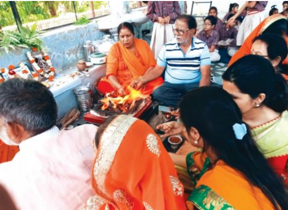
खबरों की दुनिया

रावतभाटा। चैत्र नवरात्रि की शुक्ल पक्ष अष्टमी पर मंगलवार को शहर के सिनजी पब्लिक स्कूल में गायत्री हवन अष्टमी पूजन कार्यक्रम का आयोजन हुआ। कार्यक्रम में स्टाफ सहित विद्यार्थियों ने भाग