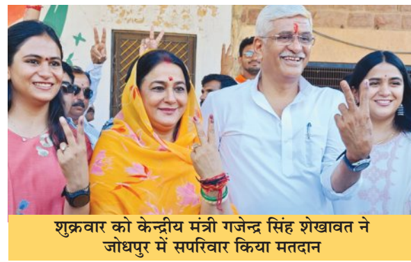
शुकुवार को केन्द्रीय मंत्री गजेन्द्र सिंह शेखावत ने जोधपुर में सपरिवार किया मतदान