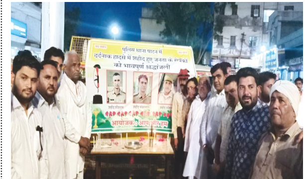
खबरों की दुनिया