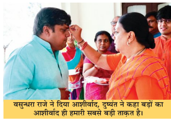
वसुंधरा राजे ने दिया आशीर्वाद, दुष्यंत ने कहा बड़ों का आशीर्वाद ही हमारी सबसे बड़ी ताकत है।

का आशीर्वाद दिया। कोटा में ओम विरला ने मतदान किया। चित्तौड़गढ़ से भाजपा प्रत्याशी सीपी जोशी ने मतदान के बाद सांवरिया सेट के दर्शन कर जीत का आशीर्वाद मांगा।