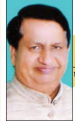
डॉ. एल. सी. भारतीय प्रखण संपादक

पहले चरण के कम मतदान से सबक सीखते हुये दूसरे चरण के मतदान में मतदाताओं और पार्टियों के कार्यकर्ताओं में जोश दिखाई दिया। मतदान केन्द्रों पर लम्बी-लम्बी कतारें देखी गईं। प्रचण्ड गर्मी की परवाह किये बिना लोग वोट डालने घर से निकले गत बार का वोटिंग प्रतिशत तो तीन बजे तक ही पूरा हो गया। दिन ढलते-ढलते वोटिंग प्रतिशत बढ़ता गया अन्त में शाम 6 बजे तक वोटिंग समाप्त के समय तक लगभग 64 प्रतिशत से ऊपर रहा जो सभी पार्टियों को उत्साहित करने वाला है। बढ़े हुये मतदान को सभी पार्टियाँ अपने-अपने पक्ष में मान रही हैं। राजस्थान ही नहीं पूरे देश में मतदान प्रतिशत बढ़ा है जो लोकतन्त्र के लिये शुभ संकेत है। उत्तर प्रदेश, बिहार, महाराष्ट्र में मतदान कुछ-कुछ प्रथम चरण जैसा ही रहा।