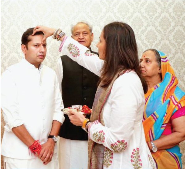
अशोक गहलोत ने पुत्र वैभव गहलोत को जालोर-सिरोही लोकसभा सीट से विजयी होने का आशीर्वाद दिया

योजना में स्वास्थ्य बीमा का कवरेज निरंतर प्राप्त करने के लिए पात्र परिवार 30 अप्रैल, 2024 तक आवश्यक रूप से पॉलिसी का नवीनीकरण कराएं। पॉलिसी नवीनीकरण ई-निर्भर के माध्यम से या स्वयं की एएसओआईडी द्वारा किया जा सकता है।