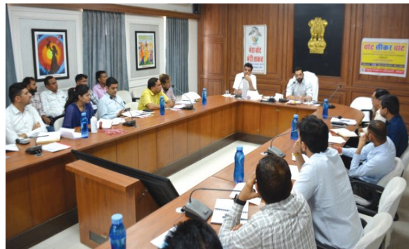
जिला कलेक्टर ने राजस्व अधिकारियों को नवशों में रास्तों एवं सड़कों की स्थिति दर्ज करने, खाता विभाजन और बंटवारे के प्रकरणों का प्रत्येक पटवार मंडल में निस्तारण करने के लिए निर्देशित किया। जिला कलेक्टर कमर उल जमान चौधरी ने निर्देश दिए कि हर माह की 20 से 25 तक आरओ बैठक हो जानी चाहिए। उन्होंने 91ए के चारागाह भूमि पर अतिक्रमण के प्रकरणों में संबंधित तहसीलदार को मौके पर संबंधित क्षेत्र के कच्चे पक्के घरों का सर्वे करवाया जाने, घरों की आर्थिक स्थिति का आंकलन करने, आस-पास कोई

सीकर। जिला कलेक्टर कमर उल जमान चौधरी की अध्यक्षता में गुरुवार को राजस्व अधिकारियों की बैठक कलेक्टर सभागार में आयोजित हुई। बैठक में जिला कलेक्टर चौधरी ने सभी अधिकारियों से राजस्व मामलों की प्रगति रिपोर्ट ली तथा संबंधित अधिकारियों को उनसे संबंधित राजस्व कार्यों को मिशन मोड पर लेकर उनका त्वरित निस्तारण करने के निर्देश दिए। बैठक में जिला कलेक्टर कमर चौधरी ने कहा कि अधीनस्थ न्यायालयों में जो लंबित मामले चल रहे हैं, उनसे संबंधित अधिकारी मिशन मोड पर लेकर उनका निस्तारण करने के साथ ही एलएए एक्ट के तहत विचारणीय मामलों के निस्तारण के लिए प्रगति लाना सुनिश्चित करें। उन्होंने कहा कि जिले में नामांतरण और रास्तों के मामले जो वर्षों से लंबित चल रहे हैं, उनको आवश्यक दस्तावेजों की पूर्ति करवाकर रिपोर्ट तैयार कर भिजवाने के निर्देश दिए। सम्पर्क पोर्टल के प्रकरण भी तत्काल निस्तारण करवायें। सभी राजस्व अधिकारी राजस्व प्रकरणों में तहसीलवार लक्ष्य निर्धारित कर प्रकरणों का निस्तारण करना सुनिश्चित करें। अतिरिक्त जिला कलेक्टर सीकर रणजीत सिंह ने राजस्व अधिकारियों से कहा कि सुमेटों के प्रकरणों के निस्तारण में एक रूपता होनी चाहिए। उन्होंने राजस्व नियम 136 के संबंध में सभी अधिकारियों से चर्चा कर यह निर्देशित किया गया कि आटो रिएक्शन का रिव्यू कर तहसीलवार परिवादी को राहत देना सुनिश्चित करें तथा लाईट्स के प्रकरणों में अपेक्षित रिपोर्ट प्राप्त कर निस्तारण करवायें। बैठक में उप महानिरीक्षक पंजीयक एवं मुद्रांक भागीरथ शाह, समस्त उपखण्ड अधिकारी, तहसीलदार उपस्थित रहे।