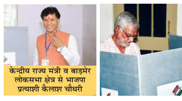
केन्द्रीय राज्य मंत्री व बाड़मेर लोकसभा क्षेत्र से भाजपा प्रत्याशी कैलाश चौधरी