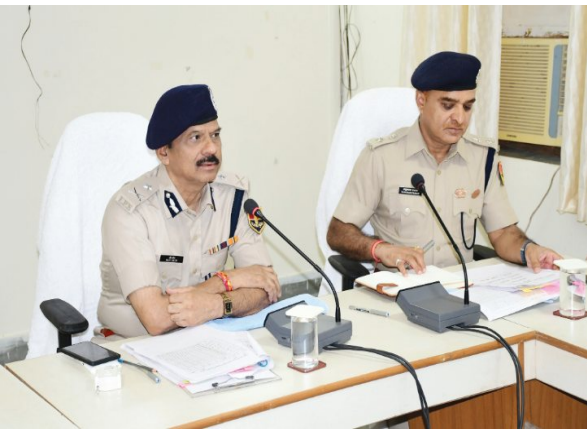
दिशा-निर्देश दिये। वांछित अपराधियों की गिरफ्तारी करने, अवैध खनन पर रोक लगाने, वाहन दुर्घटनाओं पर अंकुश लगाने,