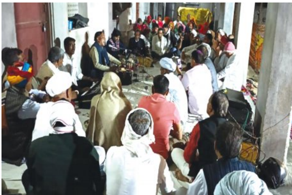
पर्वत जाजो जी लेता तो आज्यो बाला संजीवन बूटी सहित अनेक