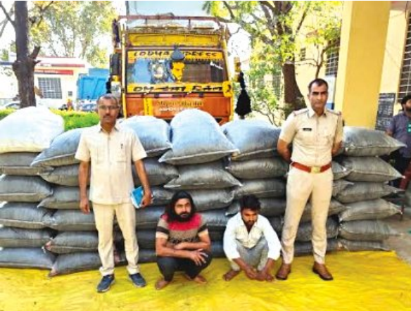
खबरों की दुनिया