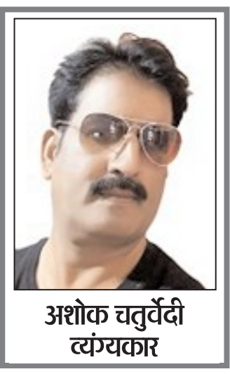
अशोक चतुर्वेदी व्यंग्यकार