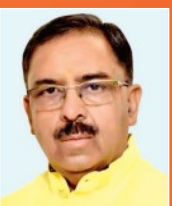
अरुण चतुर्वेदी अध्यक्ष, वित्त आयोग