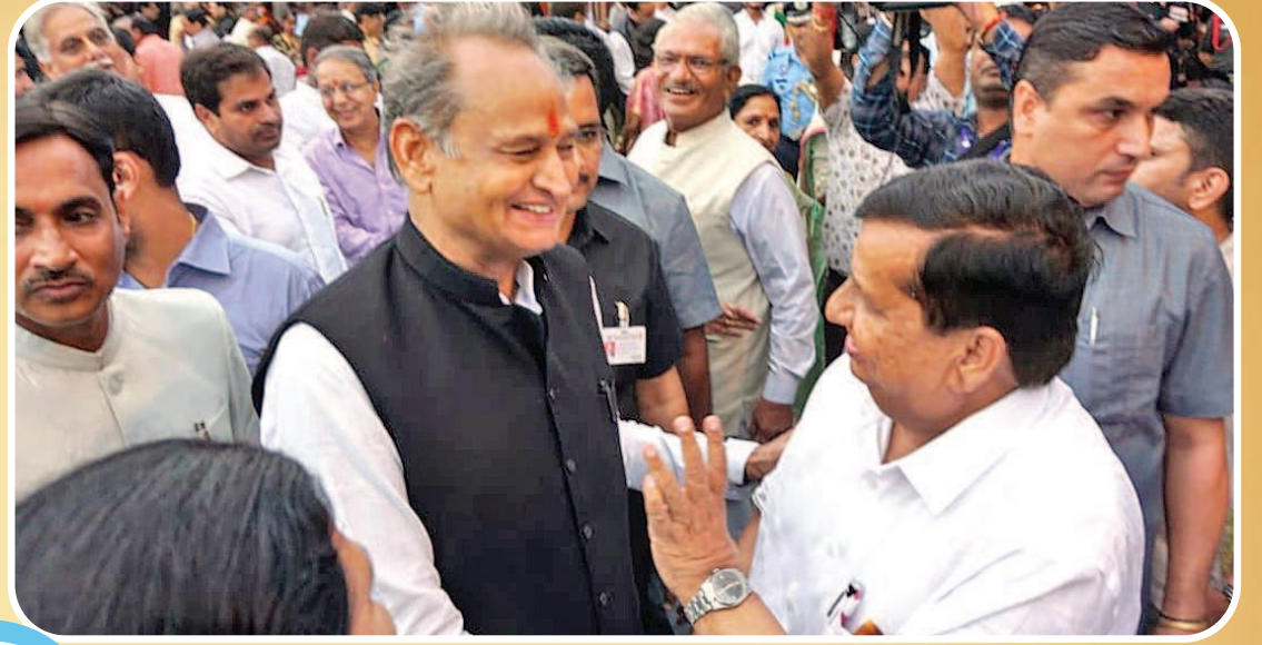
तात्कालीन मुख्यमंत्री अशोक गहलोत के साथ डॉ. भारतीय।