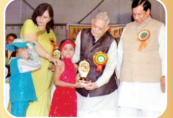
गुजरात के तात्कालीन राज्यपाल पं. नवलकिशोर शर्मा का अभिनन्दन करती हुई आकाशदीप की छात्राएं।