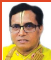
संत मुरलीमनोहर कथावाचक