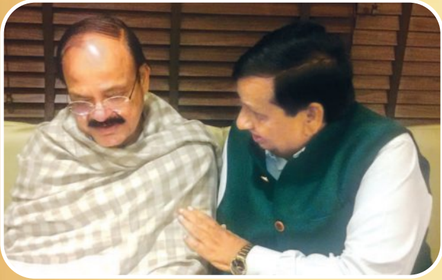
तात्कालीन उपराष्ट्रपति वेंकैया नायडू के साथ डॉ. भारतीय।