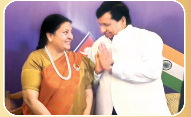
नेपाल की राष्ट्रपति के साथ डॉ. भारतीय।